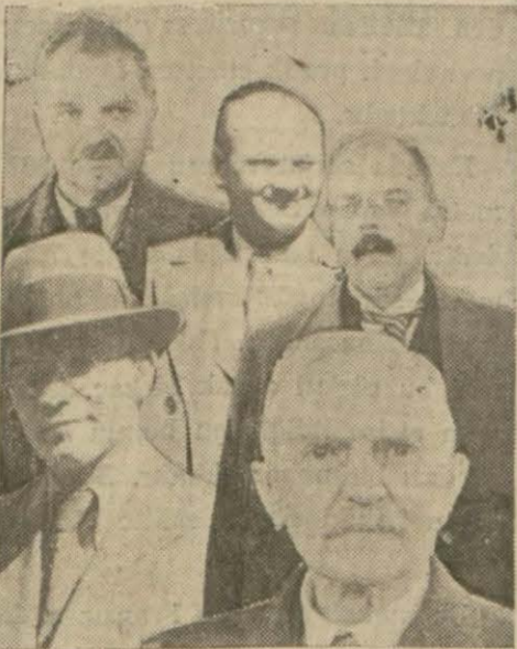
Dün şehrimize gelen ecnebi âlimler

— İlk defa on sene evvel İstanbul'a gelmiş ve asari atika müzesinde tetkikatta bulunmuştum. İstanbul'da dört ay (Devamı 7 inci sayfada)