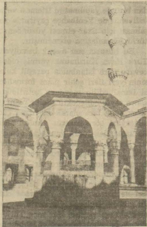
Susuz kalan camii şadırvanlarından biri

28 Mayıs 1937 tarihli Dünyu unumiyet meclisinin kararına göre Ünitürk kuponlarının 25 teşrinisanide tediyesine dair bir tamim yapılmıştır. Hükümet, kupon tediyatını frank veya dolar olarak tediyeye etmekle muhtar bulunmaktadır. 25 teşrinisanide frank olarak tediyeye yapılacaktır. Bu suretle cari hesaplara göre beher kupon başına 80 kuruş isabet etmektedir.