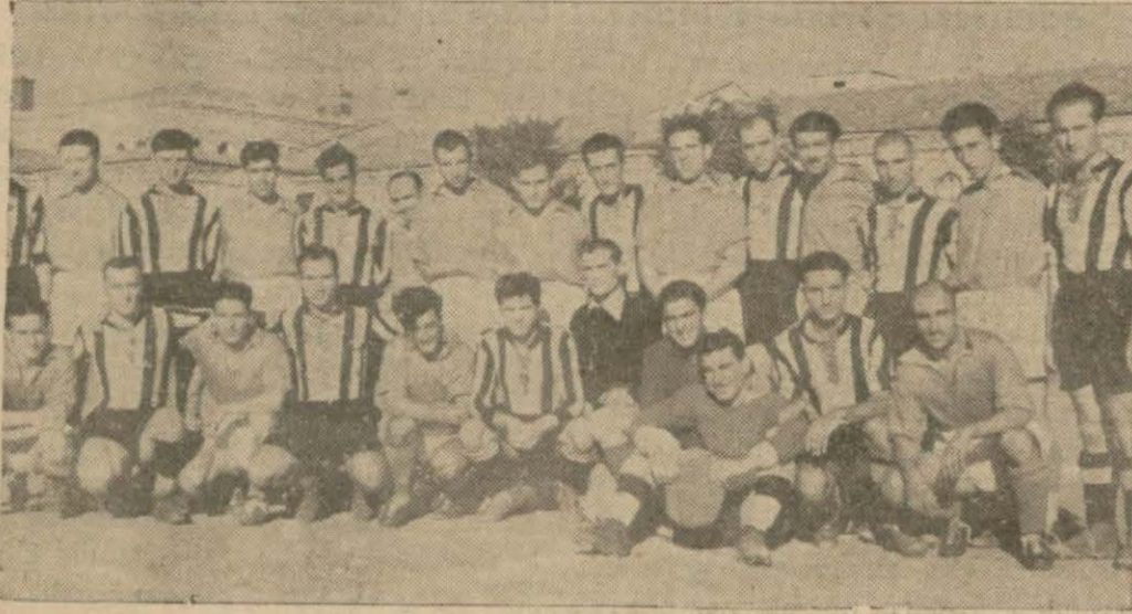
Doğu muhtelisi ve Beşiktaş bir arada

Oyun tecrübeleri noksan, fakat sür'at ve çeviklikleri fazla olan Doğu takımı ihmal edilir bir kuvvet değildir