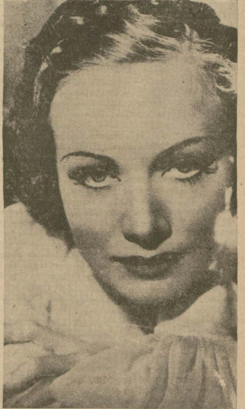
Yeni Norveçli Sigrid Gurie

rolü vermiştir. Pek yakında meşhur san'atkar Gary Cooper'in çevirecek olduğu «Marko Polo'nun sergüzeşleri» adındaki tarihi filmde baş kadın rolünü yapacaktır. Bu filmde Gary Cooper'ı 144 defa öpecektir!