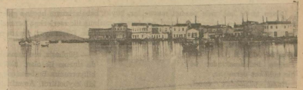
Ayvalıktan bir görünüş

Ayvalıklılar su, Adapazarlılık, Somahlılar doktor, Akçekocalılar da vapur istiyorlar