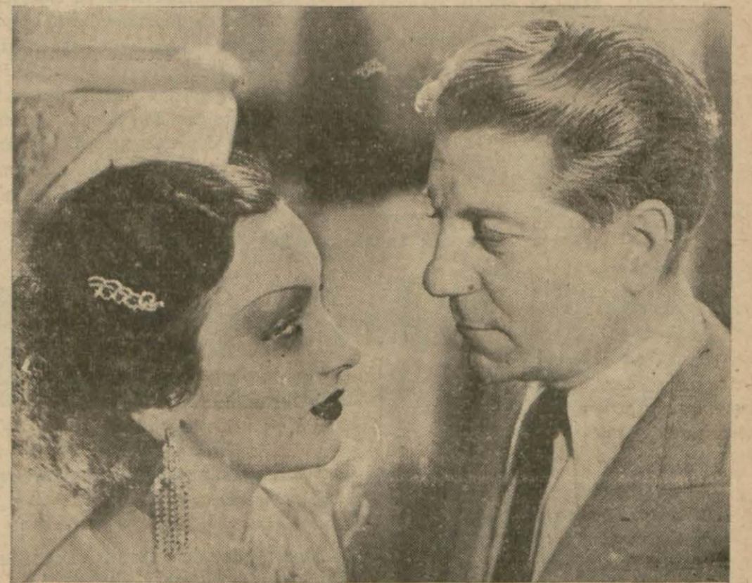
Jean Gabin ve Mireille Ballin Cezair batakhaneleri filminde

Bu hafta İpek sinemasında «Cezair batakhaneleri» isminde güzel bir film gösterilmektedir.