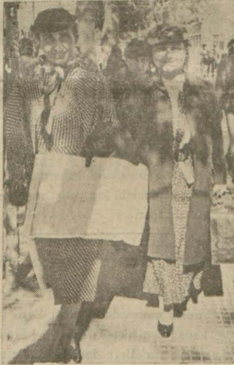
Bayan meb'uslar Ankara'da

Encümenine havale edilen lâyiha'lar şunlardır: (Devamı 11 inci sayfada)