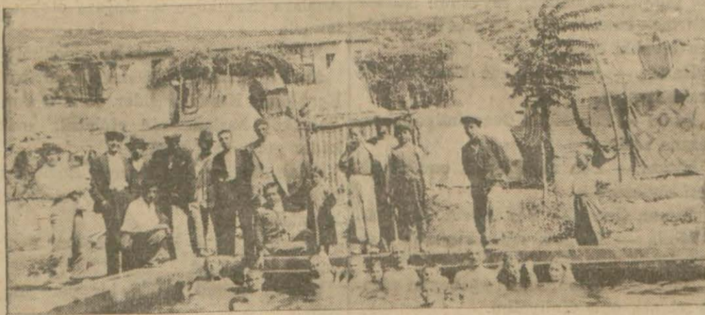
Kütahya İhcalarından birinin görünüşü

Kütahya (Hususî) — Her şehirde olduğu gibi burada da halk yazın yazlık yerlere akın eder. Buranın belli başlı yazlıkları Ilıca, Çamlıca ve Yoncalıdır. Ilıca, şehre 28 kilometre mesafede, şimalde, bir tepenin üzerindedir. İhcalarda bir kaç türlü su var, bir kaç türlü hava ve güzel manzaralar vardır. Tepelerde hava serin ve serttir. Yirmi, yirmi beş metre aşağıda nisbeten sıcak bir hava vardır. Hamamlar cehennem gibidir. Haslas denilen bir soğuk su